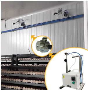
HALOFOG 300 Hatch